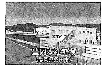
豊岡本社工場 (静岡県磐田市)

リフォームは、こうした利用者の手間を省く、対象商品をパッケージ価格で比較検討を可能としている。対象となる「もみじ彩る川上未来の森」(マルヤマグループ100th)は、同市川上丸野地内の面積10.57haの森林で、協定期間は2022年3月末まで。 活動内容は、森林づくり(苗木の育成や植栽、下刈り、枝打ち、除間伐等)や地域交流、ぎふ木育(地元小学校を対象とした森林・環境学習への協力等)、森林環境保全(モリアオガエル繁殖に向けた生息地の環境整備等)など。 11日には、第1回活動として中津川市川上丸野地内(夕森公園)で結団式と森林学習を開く予定だ。