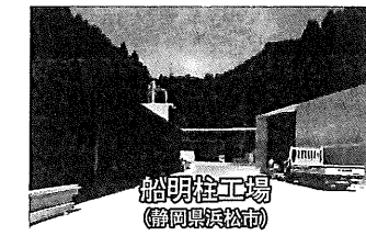
船現柱工場 (静岡県浜松市)