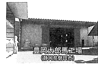
豊岡太郎馬工場 (静岡県磐田市)