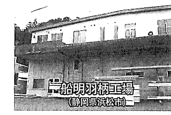
船現羽根工場 (静岡県浜松市)

在来軸組工法・金物工法・ハイブリッド工法フルプレカットにも対応しています。詳しくは各営業部にお問い合わせ下さい。